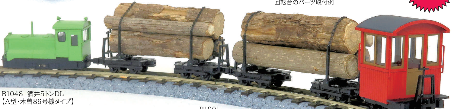
B1048 酒井5トンDL 【A型・木曾86号機タイプ】