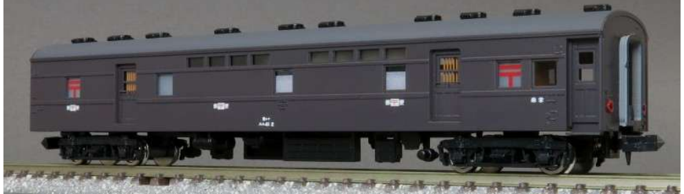
スユ41ぶどう色1号(保護棒は黄かつ色)の完成例