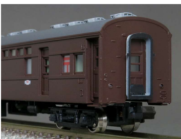
オユ61 1~(側引戸改造後 ぶどう色2号)の完成例