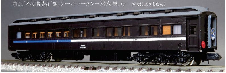
特急「不定期燕」「鷗」テールマークシートも付属。(シールではありません)

昭和12年7月～ 特急「鷗」 1031・1032列車 ●牽引機 C53など(EF53なども牽引と推定)