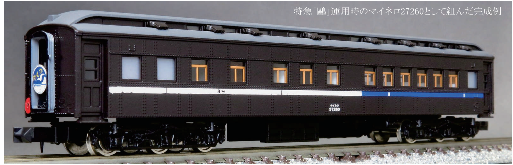
特急「鷗」運用時のマイネロ27260として組んだ完成例