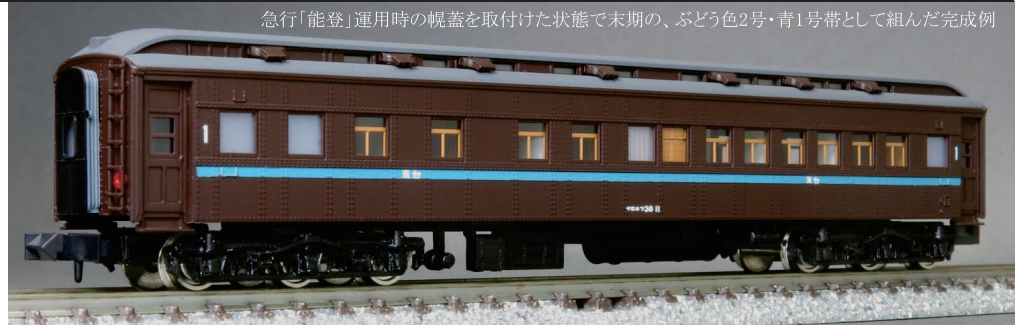
急行「能登」運用時の幌蓋を取付けた状態で末期の、ぶどう色2号・青1号帯として組んだ完成例

昭和29年7月 急行「北斗」 206列車 青森→上野 ●牽引機 C62 ●客車の塗色はぶどう色1号(ロネ・ロは青1号帯)