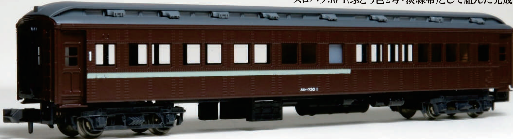
スロハフ30 1(ぶどう色2号・淡緑帯)として組んだ完成例

【台車】 GM製 (5024) TR23 【内装】 ●オヤ35の場合は不要 K4005 普通車用ボックスシート K4014 大型ボックスシート 【インレタ】 K3078 W座席車インレタ1 □窓下の標記類など[白] ●オヤ35の場合は不要 K3065 等級標記他インレタ(白) (任意) 【テールレンズ】 K3074 テールレンズ(丸屋根客車他) (12ヶ入)