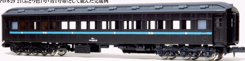
マロネ29 21(ぶどう色1号・青1号帯)として組んだ完成例

【台車】 K3059 プラ床板用TR71台車(スハシ38 1~3) K3060 プラ床板用TR73台車(スハシ38 4~5) 【煙突上部】 K4023 食堂車用ガラベン・電動発電機 または K4037 ガラベンセット 【内装】 K4005 普通車用ボックスシート K4013 食堂車テーブル・イス 【インレタ】 K3080 W座席車・食堂車インレタ K3065 等級標記他インレタ(白)