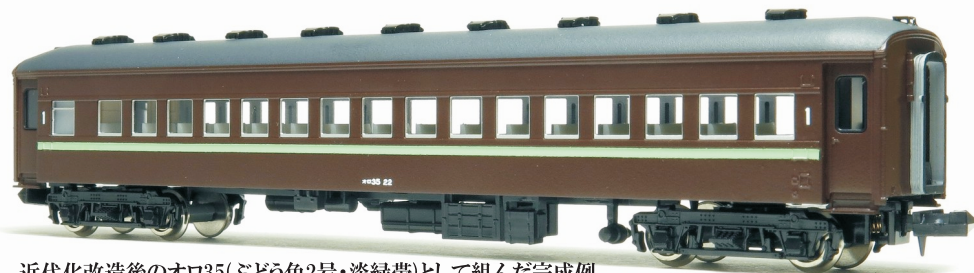
近代化改造後のオロ35(ぶどう色2号・淡緑帯)として組んだ完成例