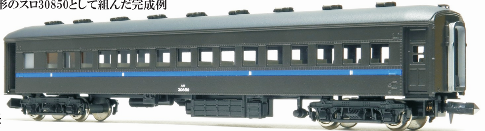
「K3922 丸屋根客車デッキ開放部品」を使用して左側の扉を開けています