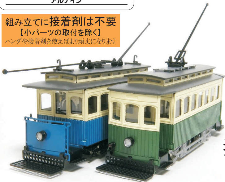
↑オプションパーツ使用例