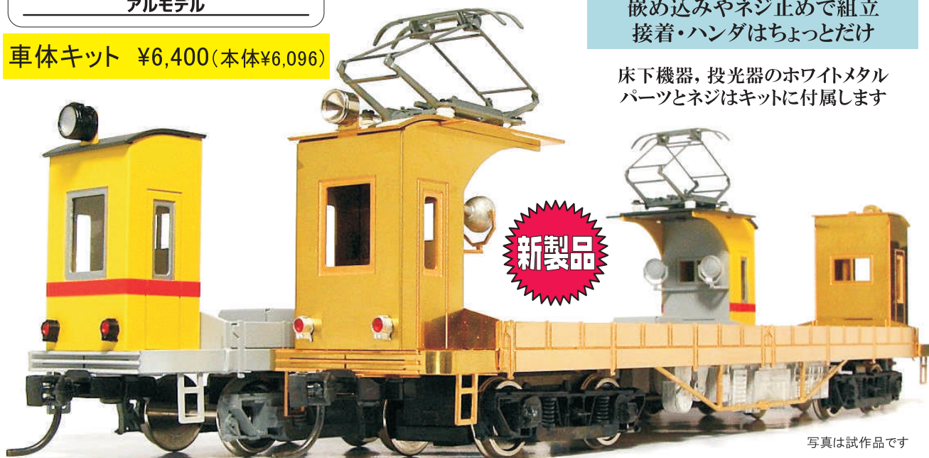
写真は試作品です